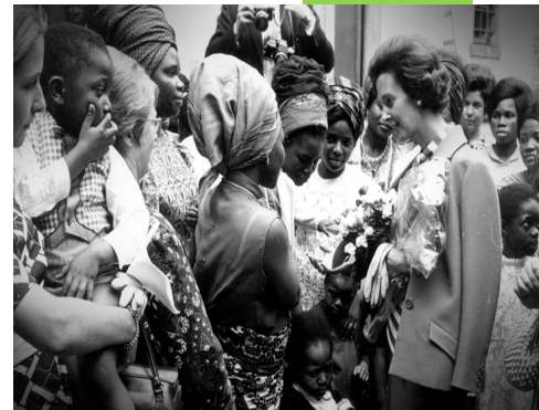
1970, inauguration de la Maison Africaine, rue d'Alsace-Lorraine, en présence de la Reine Fabiola

Par ailleurs, dans le cadre de cadre des investissements en sécurité, nous avons clôturé en 2013 les démarches relatives à l'obtention d'un permis d'urbanisme pour l'installation d'un escalier de secours externe.