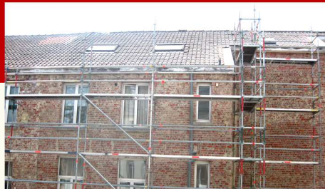
Façade — Avant restauration

Cette occupation nous a permis d'une part, de garantir une stabilité en terme de gestion (stabilité du personnel, des services, ...) et d'autre part, d'investir sereinement dans le bâtiment (voir page 4).