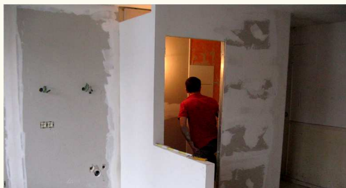
Restauration complète des chambres et studios

Les divers investissements ont nécessité de multiplier les crédits qui pèsent également sur nos charges.