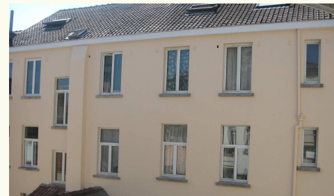
Même façade — Après restauration

Quelque 1.000 m 2 de façades ont dû être entièrement ravalés.