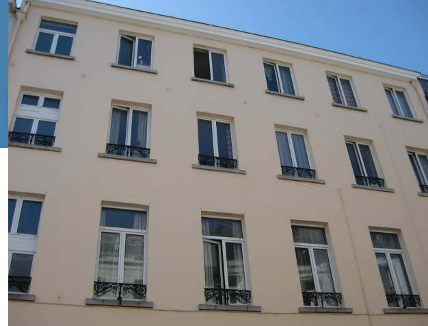
Immeuble rue de Londres